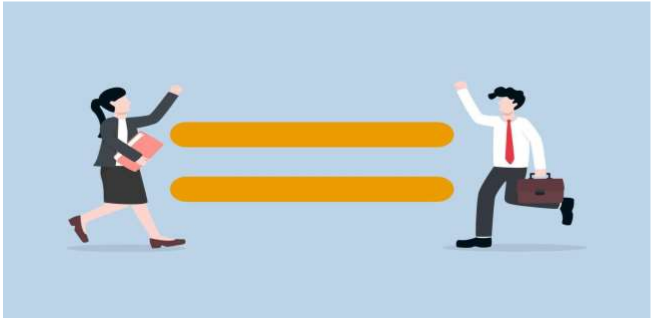
Igualdad de oportunidades