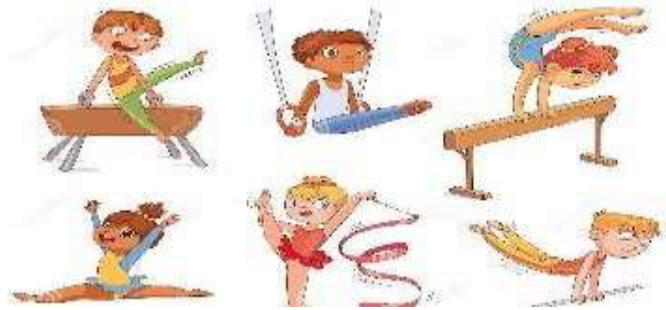
Artística y cultural